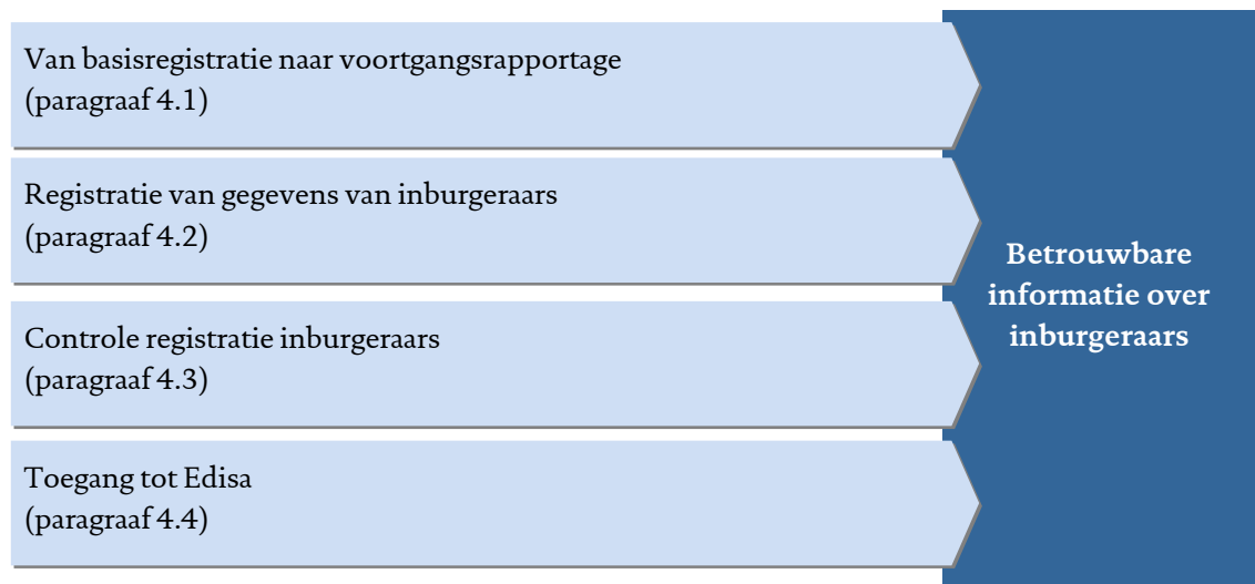
Figuur 4.1 - Toetsaspecten risico's betrouwbaarheid

De rekenkamer onderzocht aan de van de volgende toetsaspecten in hoeverre er risico's bestaan voor betrouwbare informatie over inburgering.