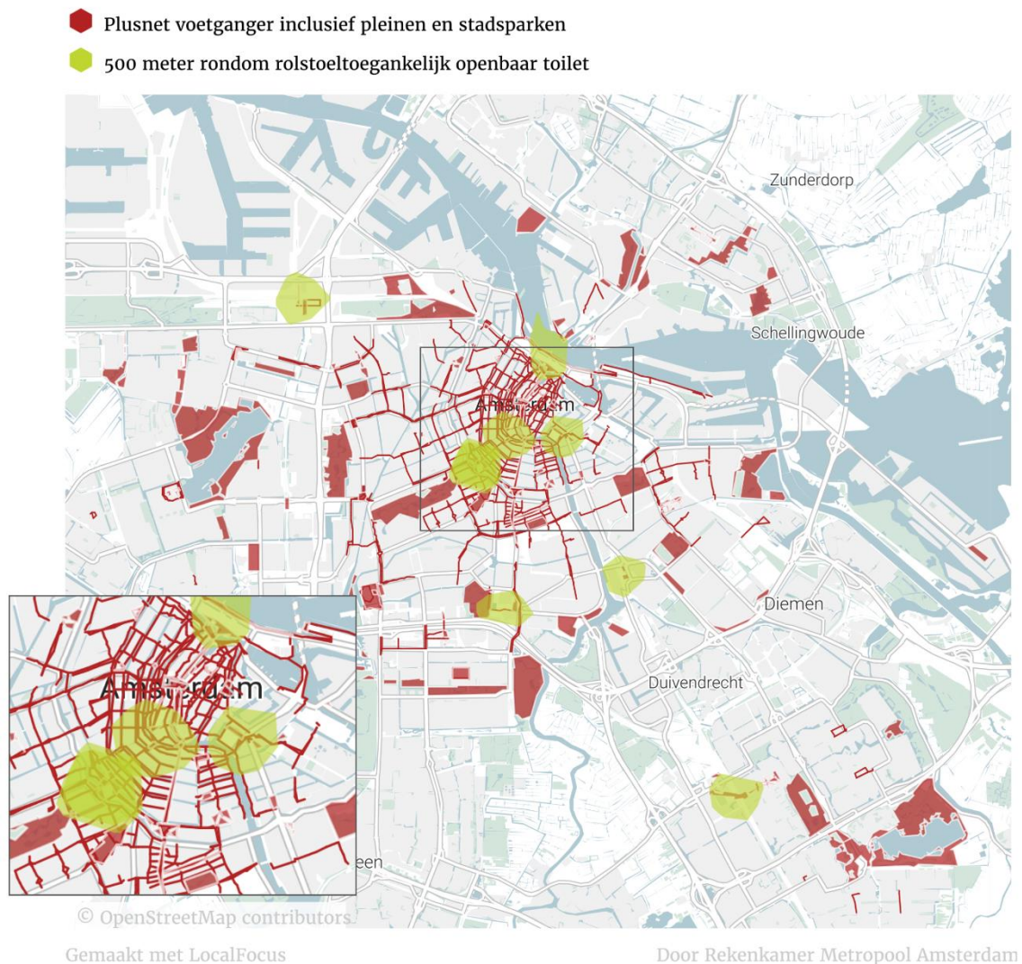
Figuur 2.2 - Dekking rolstoeltoegankelijke openbare toiletten in de nacht

Ten slotte liggen uitgaansgebieden - met uitzondering van de omgeving van het Centraal Station, Leidseplein, Europaplein en Arenaboulevard - in de nacht verder dan 500 meter van een rolstoeltoegankelijk openbaar toilet (zie figuur 2.2).