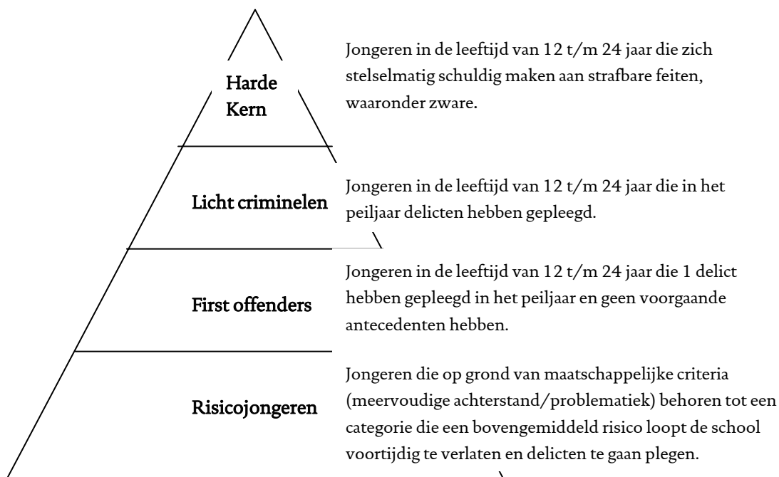
Figuur 3.1 – Doelgroepen bestrijding jeugdcriminaliteit 9

De piramidefiguur laat zien dat er sprake is van een zogenaamde opwaartse druk. Dat wil zeggen dat risicojongeren een grote kans hebben om in de groep first offenders terecht te komen. Bij het signaleren van risicojongeren en het voorkomen dat deze groep inderdaad crimineel gedrag gaat vertonen zijn meerdere instanties betrokken. Dat zijn bijvoorbeeld de school, het ouderkindcentrum (OKC), de politie, het jongerenwerk, de huisarts en de straatcoaches. Bij de stadsdelen zijn zogenaamde jeugdnetwerken 12+ opgericht, veelal onder leiding van een netwerkcoördinator 12+ van het stadsdeel. In deze netwerken bespreken de instanties jongeren die dreigen af te glijden. Hierbij is het doel om de instanties samen te laten werken om een passende oplossing voor de jongere te vinden. Voor deze jeugdnetwerken 12+ bestaat een registratiesysteem. Dit registratiesysteem moet ook bijdragen aan een gecoördineerde aanpak van de hulpverlening. 10