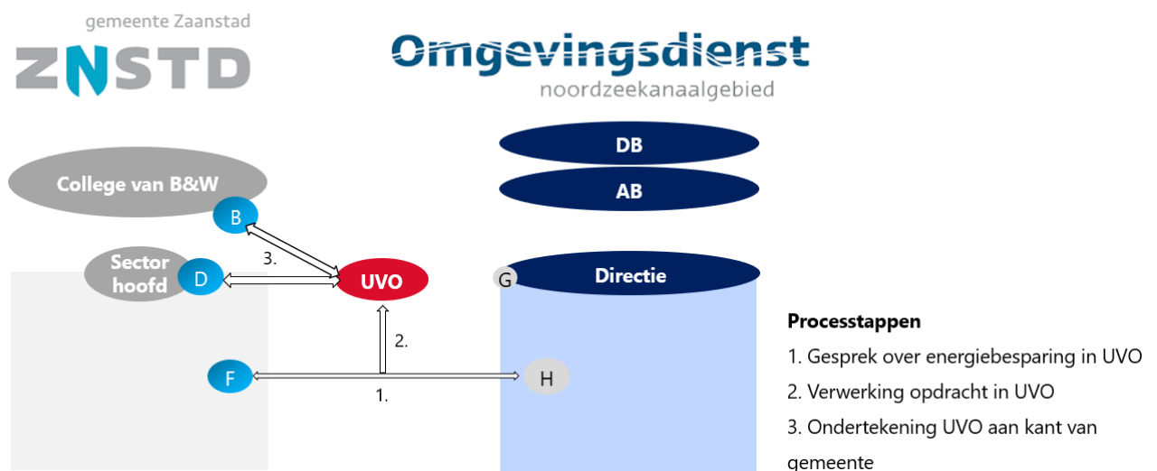
Figuur 3. Totstandkoming UVO

Aan het eind van een lopend kalenderjaar wordt voor het jaar erna het gesprek gevoerd over de nieuw vast te stellen uitvoeringsovereenkomst. Specifiek voor energiebesparing vinden er gesprekken plaats tussen de accountmanager van de OD NZKG (H) en de ambtelijk inhoudelijk betrokkene vanuit de gemeente (F) om een goed beeld te krijgen van de inzet op de energiebesparingsplicht in het jaar erna. Dit wordt vastgelegd in de UVO die ambtelijk door de bestuurlijk opdrachtgever (B) en ambtelijk opdrachtgever (D) vanuit de gemeente Zaanstad wordt ondertekend.