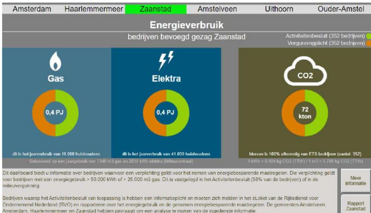
Figuur 4. Energieverbruik bevoegd gezag Zaanstad

Naar aanleiding van een informatieverzoek dat wij hebben ingediend, heeft de OD NZKG een toelichting gegeven op het dashboard. Hierbij is aangegeven dat het dashboard onder andere inzichtelijk maakt wat het totale geaggregeerde energiegebruik is van de bedrijven die dit hebben gemeld in het kader van de informatieplicht (zie figuur 4). 98 Ook biedt het dashboard, op andere tabbladen, inzicht in bijvoorbeeld het aantal inrichtingen dat zich heeft gemeld in het kader van de informatieplicht en het aantal nog te nemen maatregelen per bedrijfstak volgens deze informatie.